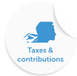
Taxes & contributions

L'abonnement m'assure que mon logement est bien alimenté par le réseau électrique. Il dépend de la puissance (mesurée en kVA) utilisée par mes appareils électriques lorsqu'ils fonctionnent simultanément. Son montant est identique à celui des tarifs réglementés.